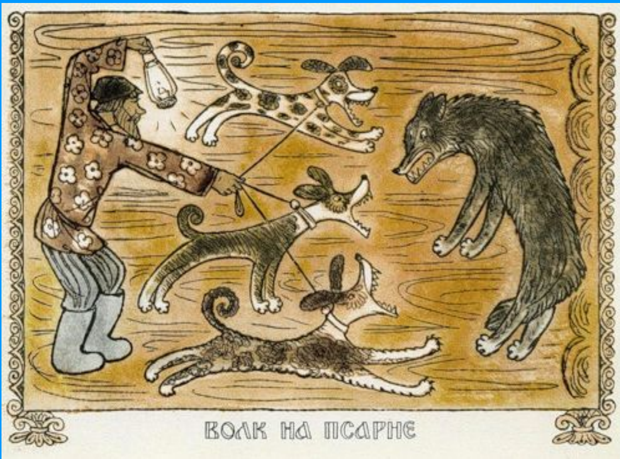
ВОЛК НА ПСАРНЕ