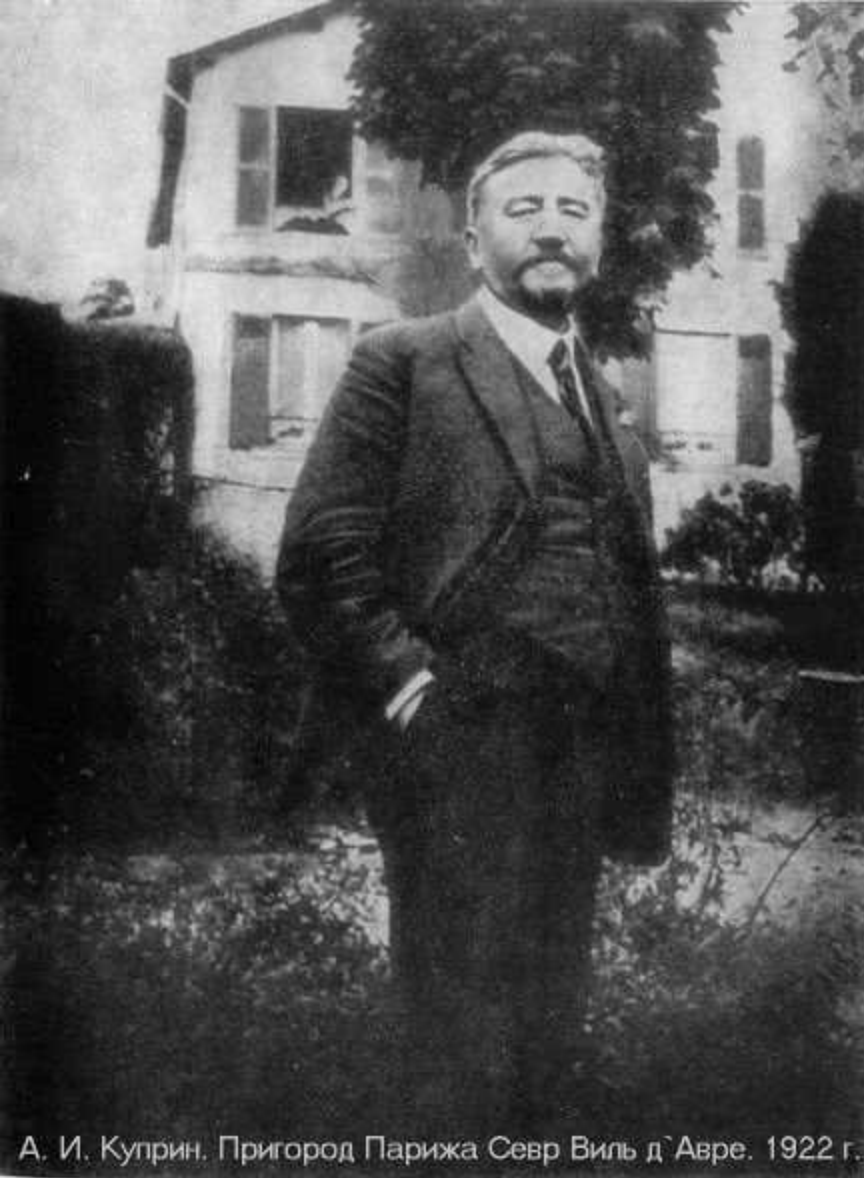
А. И. Куприн. Пригород Парижа Севр Виль д'Авре. 1922 г.