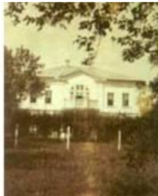
Открыл школу для бедных детей в Ясной Поляне