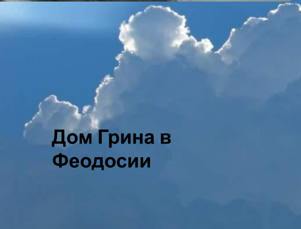
Дом Грина в Феодосии