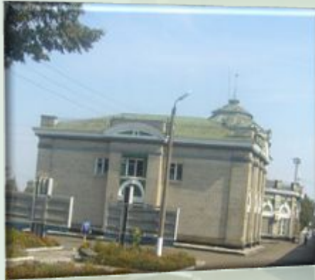
п.Ирпень, Украина, родина Н. Носова