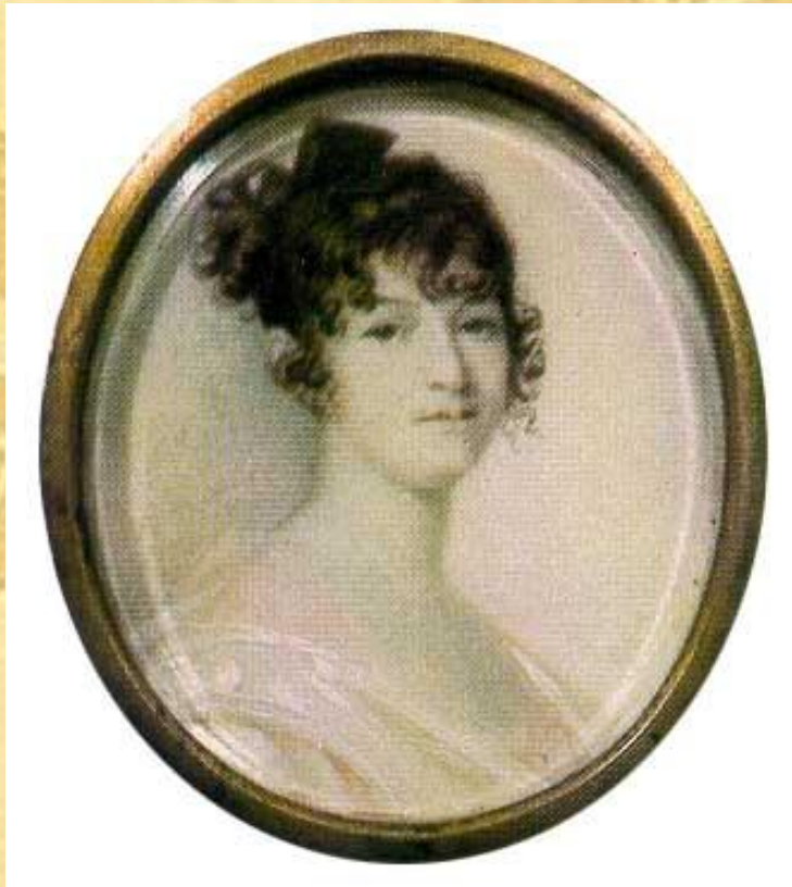
Н.О. Пушкина. 1800-е гг.

Мать, Надежда Осиповна , приходилась внучкой араму Петра I, впоследствии русскому генералу Ганнибалу.