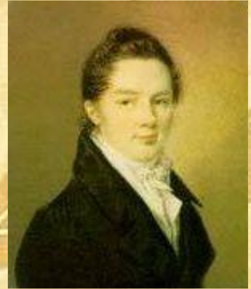
Иван Иванович Пуцин

Пушкин сохранил лицейскую дружбу и культ Лицея на всю жизнь.