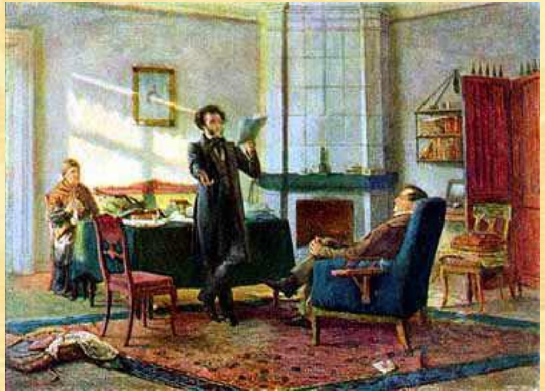
Пушкин в селе Михайловском (Пушкин у Пушкина). Н.Н. Ге. 1875 г.

За три года ссылки написаны "Кавказский пленник", "Бахчисарайский фонтан", а также "Узник", "Песнь о Вещем Олеге». Начат роман в стихах "Евгений Онегин".