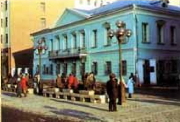
Квартира Пушкина в Москве на Арбате

18 февраля 1831 г. в церкви Вознесения Господня состоялось его венчание с Н. Н.Гончаровой. Первые месяцы семейной жизни он провел с женой в Москве, сняв квартиру на Арбате