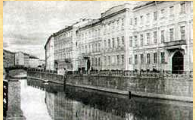
Квартира Пушкина в Петербурге на Набережной Мойки

С середины октября 1831 г. и уже до конца жизни Пушкин с семьей живет в Петербурге.