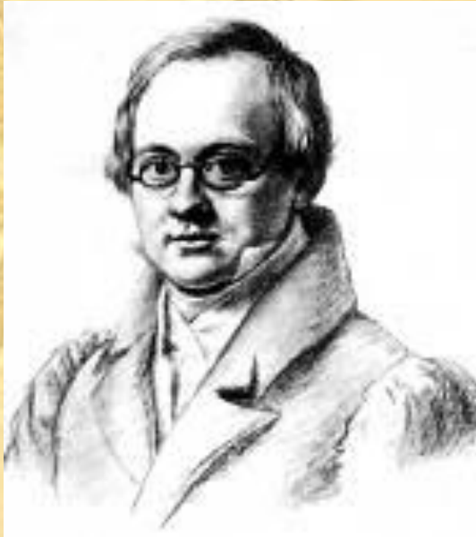
Антон Антонович Дельвиг