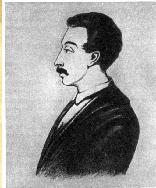
Вильгельм Карлович Кюхельбекер