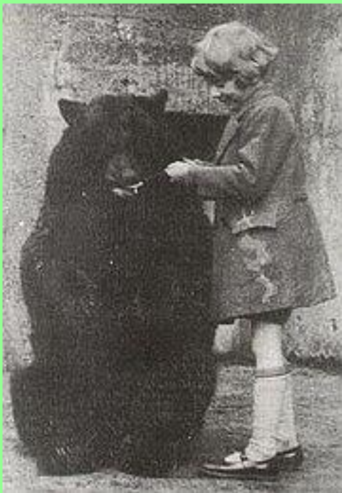
Медведица Винни, Лондонский зоопарк. 1924 год