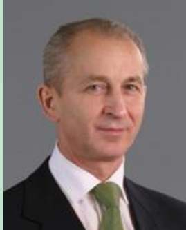
Андрианов Владимир Дмитриевич , первый заместитель Председателя Правительства РФ