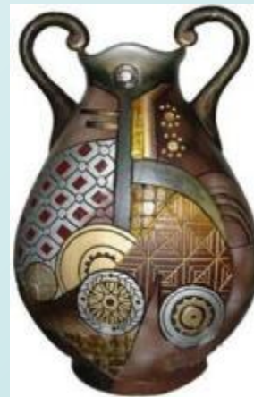
Предметы из глины