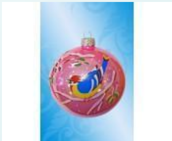
Предметы из стекла