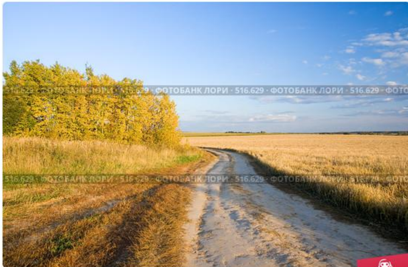
Осенняя роща, поле и проселочная дорога