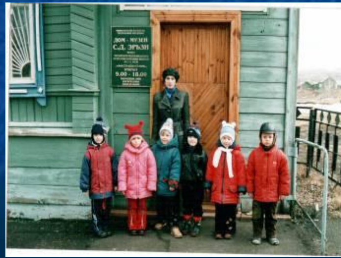
Экскурсия в дом-музей С.Д.Эрзы