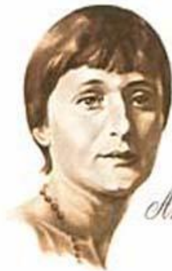
Анна Ахматова 1889 — 1966