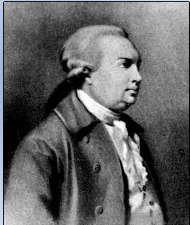
Неизвестный художник 18 века