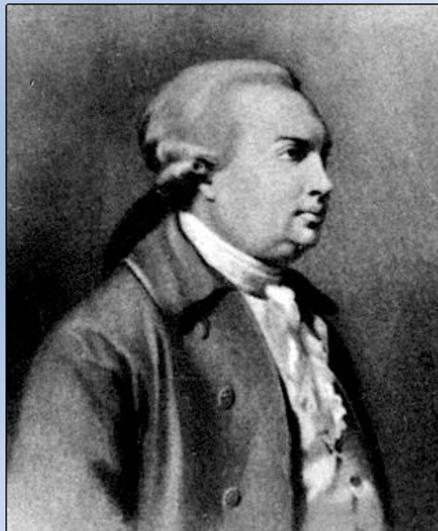
Неизвестный художник 18 века