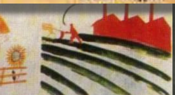
4. ЗАЙМУТСЯ ДЛЯ РАСЦВЕТА РОССИИ ТРУДОМ.