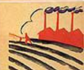
4. ЗАЙМУТСЯ ДЛЯ РАСЦВЕТА РОССИИ ТРУДОМ.