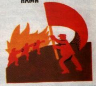
6. ДОНЕСЕМ ДО ОСВОБОЖДЕНИЯ ВСЕГО СВЕТА