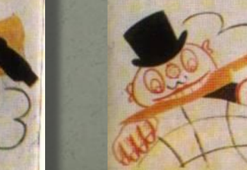
ОДНО НЕ ЗАБУДЬ - ЖИВ НАПАТИЛИЗМ В 3/4 СВЕТА.