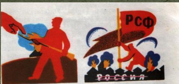
1. ШТЫК КРАСНОГВАРДЕЙЦА ВОЗМОЖНОСТЬ ДАЛ