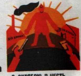
8. ОКТЯБРУ В ЧЕСТЬ РАБОТУ ПО УКРЕПЛЕНИЮ АРМИИ ВЕСТЬ