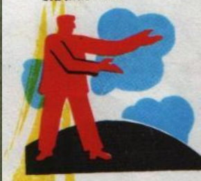
7. ТАК СТАРАЙСЯ-Ж КАЖДЫЙ