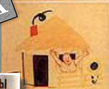
3. ВЕРНУТСЯ СОЛДАТЫ К СЕБЕ В ДОМ,