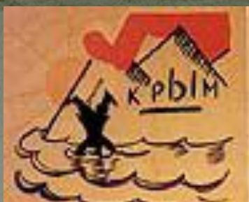
1. ФРАГ ПОСЛЕДНИЙ ГОТОВ!