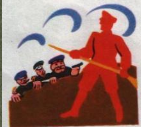
3. ТОЛЬКО ШТЫК КРАСНОАРМЕЙЦА ОХРАНИЛ ЭТО ЗНАМЯ