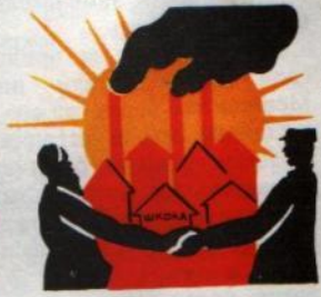
4. ОКТЯБРЬСКУЮ РЕВОЛЮЦИЮ ЗАКРЕПИЛ ЗА НАМИ