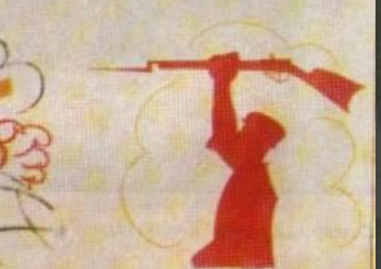
6. ГОТОВ БУДЬ!