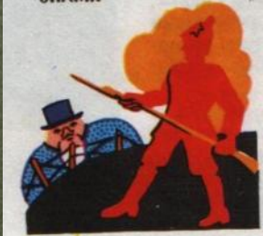
5. ТОЛЬКО С ПОМОЩЬЮ КРАСНОАРМЕЙЦЕВ ЗНАМЯ ЭТО