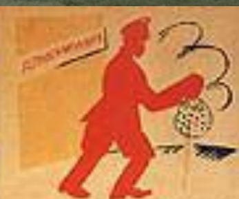
2. ПОСТЕПЕННО БУДУТ ОТПУСКАТЬ ПРЯЖЕНЫЕ СТАРИКИ ГОДОВ.