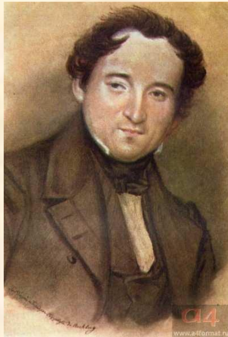
Ф.И. Тютчев. Художник И. Рухберг. 1838

Так мило-благодатна, Воздушна и светла, Душе моей стократно Любовь твоя была. (1858)