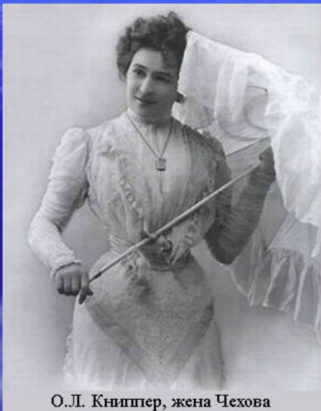
О.Л. Книппер, жена Чехова