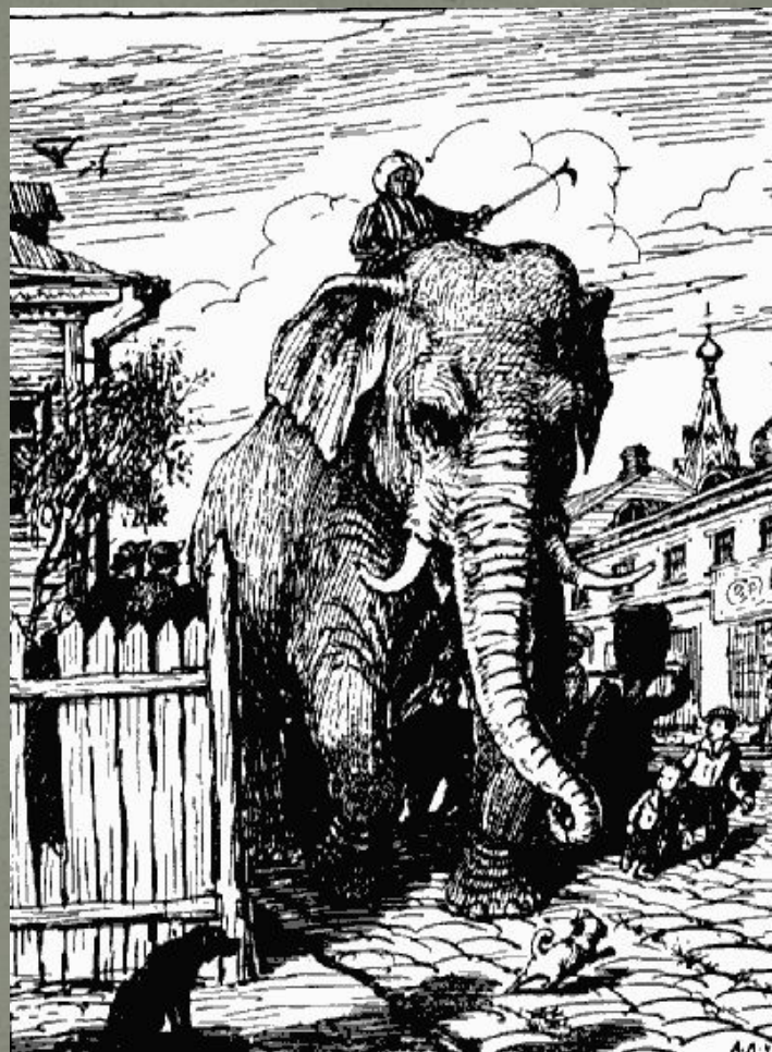
Слон и Моська