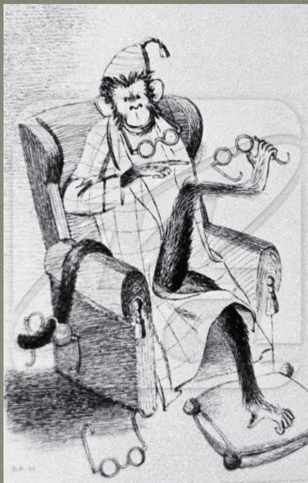
Мартышка и очки