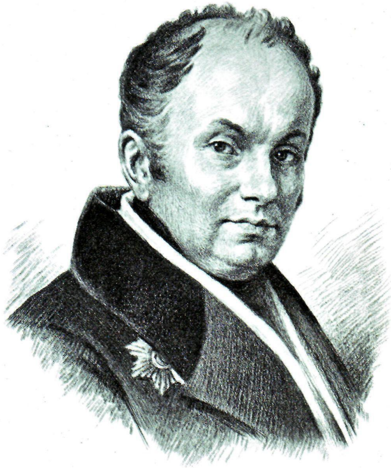
Василий Андреевич ЖУКОВСКИЙ (1783—1852)

После «Руслана и Людмилы» Жуковский надписал Пушкину свою фотографию: «Победителю-ученику от побежденного учителя». Жуковский был рядом с Пушкиным на протяжении почти всей его жизни. Он неоднократно заступался за Пушкина перед царем и находился у постели смертельно раненного поэта в его последней квартире на набережной реки Мойки, в доме 12. Он вывешивал сообщения о состоянии великого поэта.