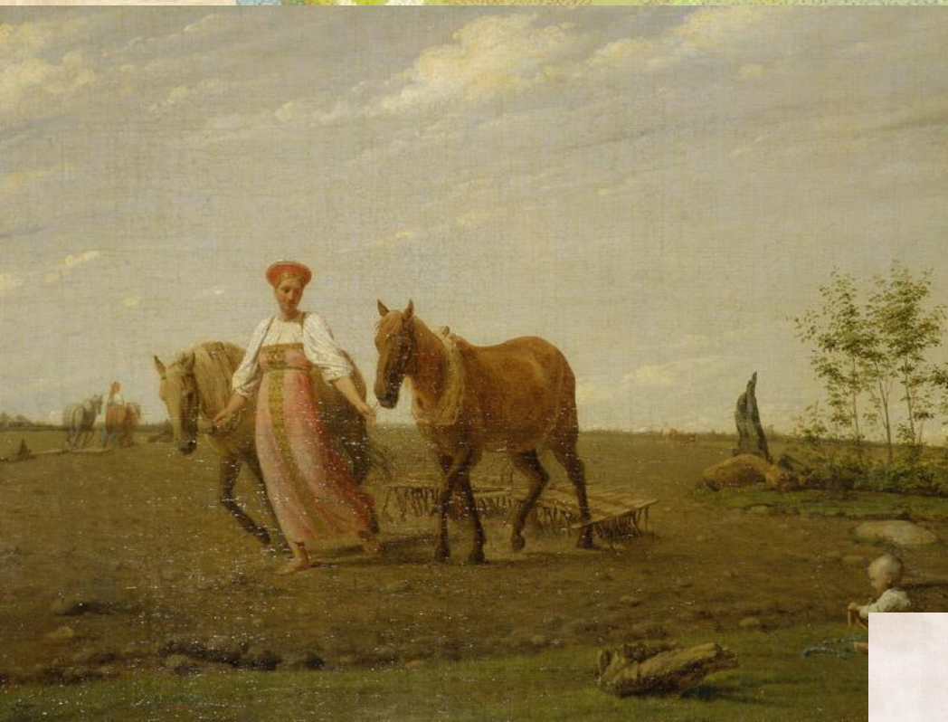
А. Венецианов. На пашне. Весна