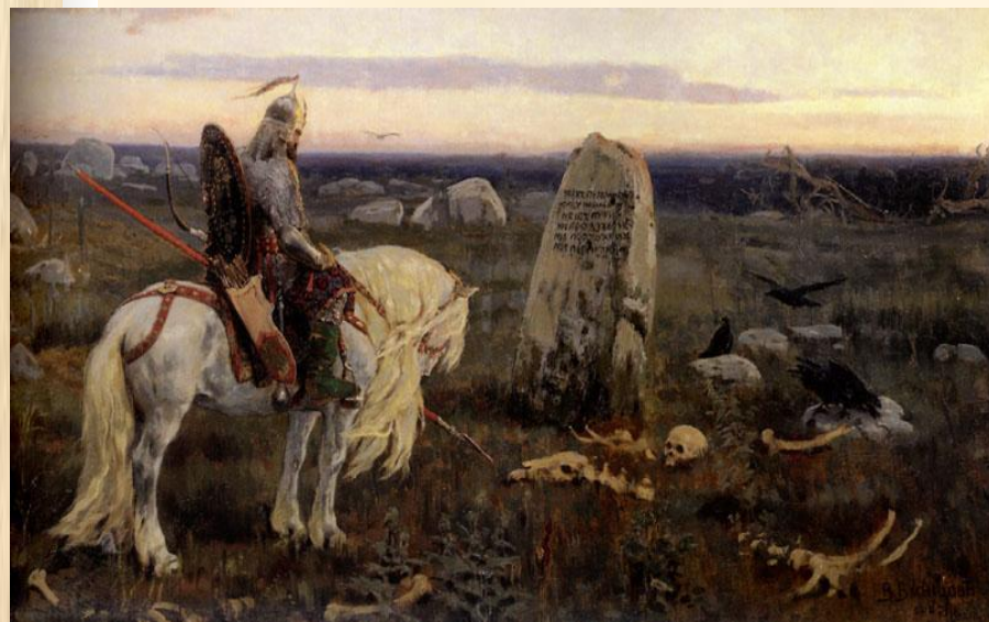
Васнецов. Витязь на распутье