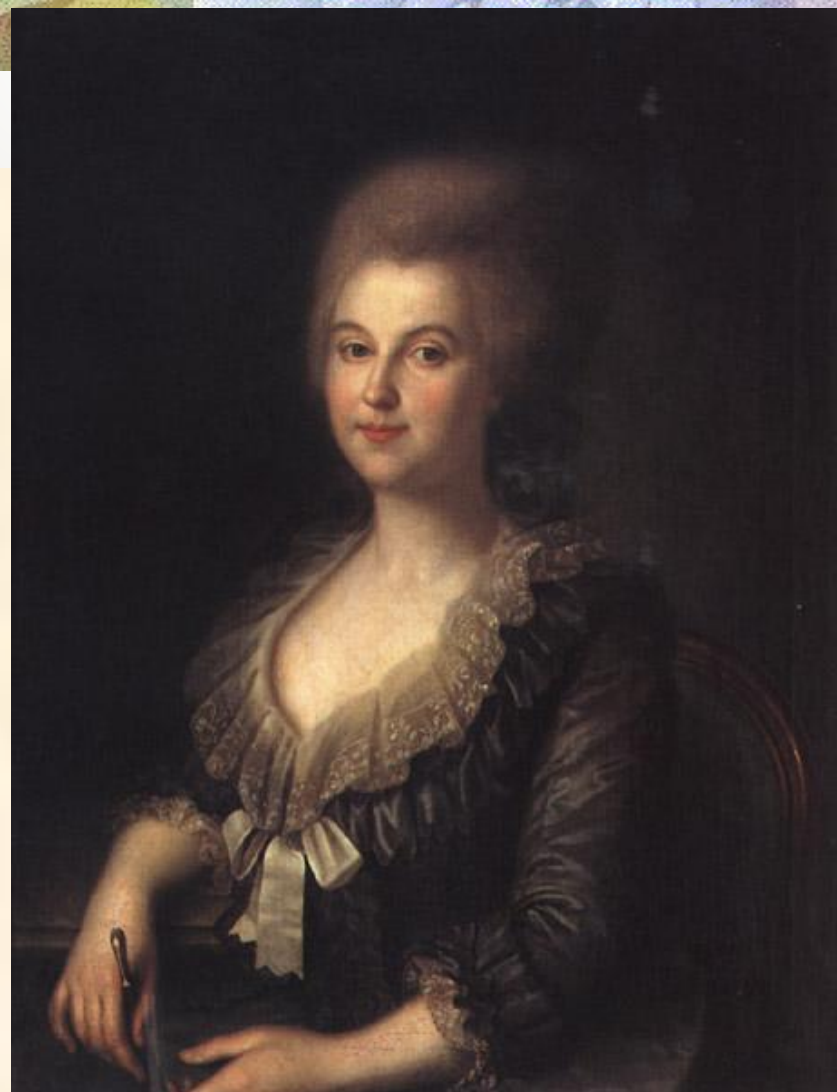
И. Аргунов. Портрет Ветошниковой