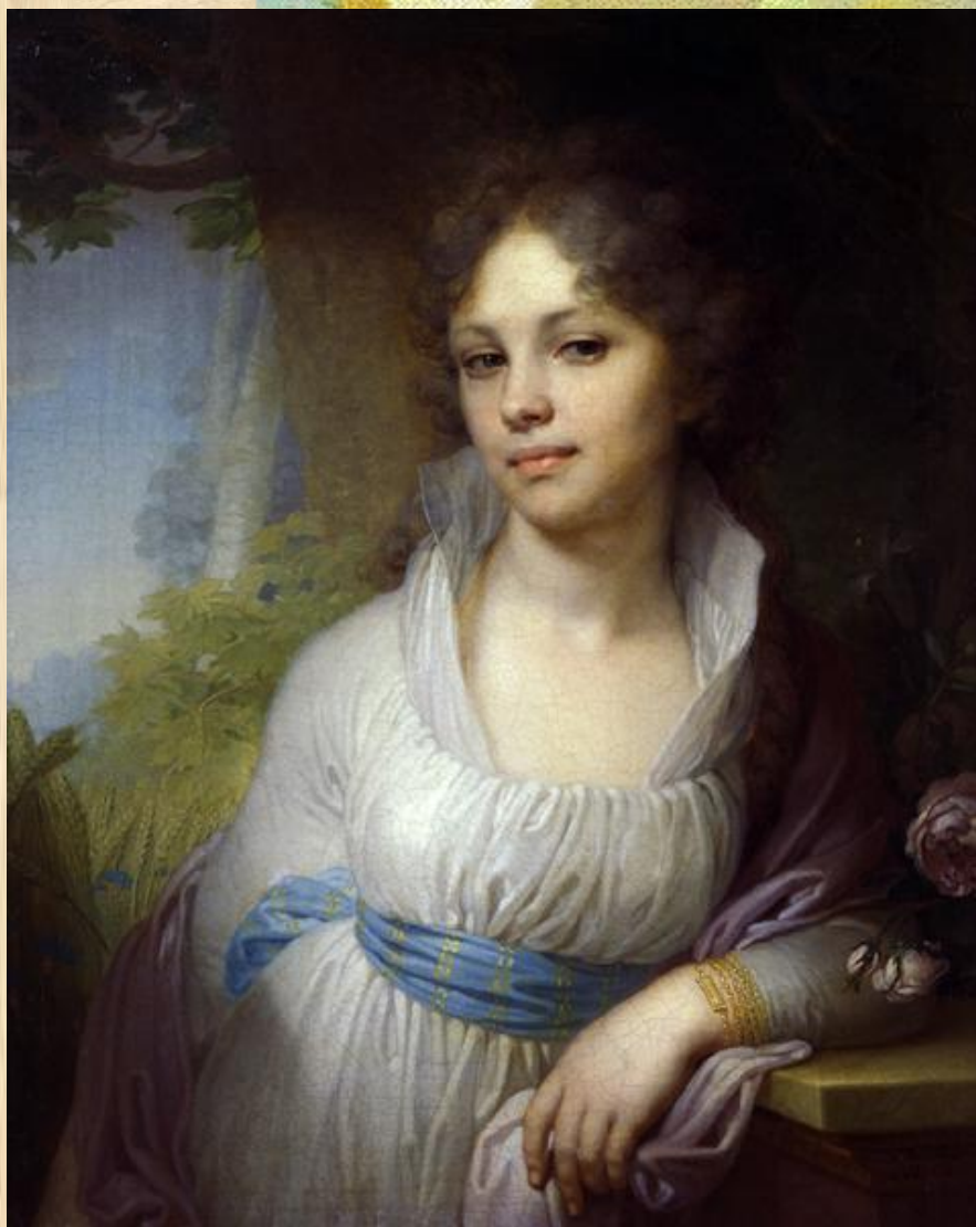
В. Боровиковский. Портрет Лопухиной