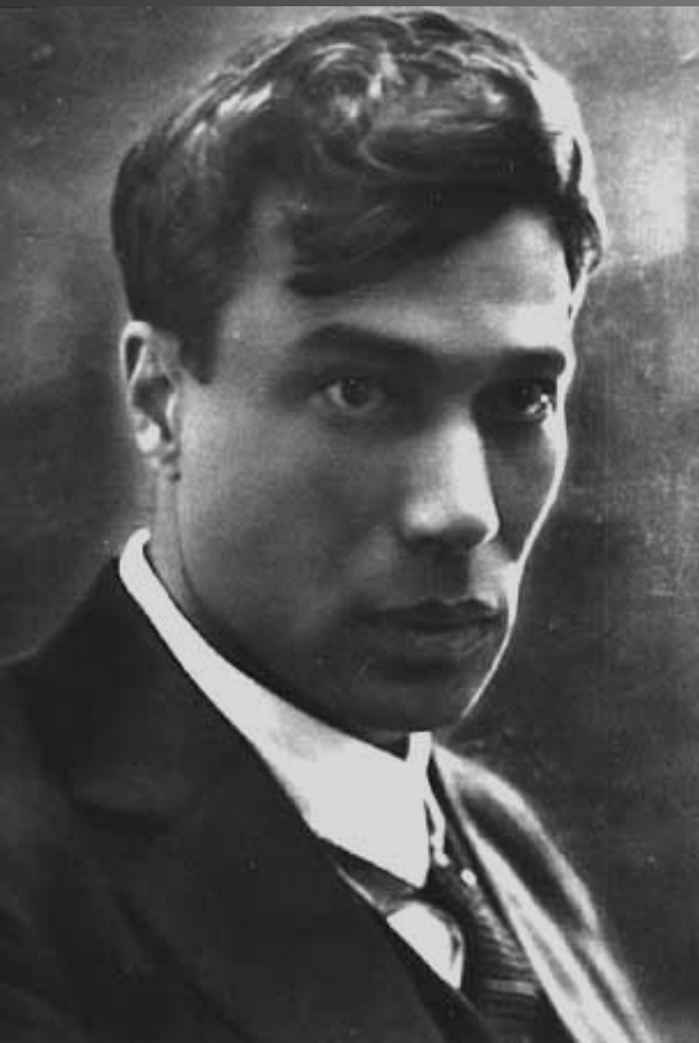
Пастернак, Борис Леонидович (1890-1960)