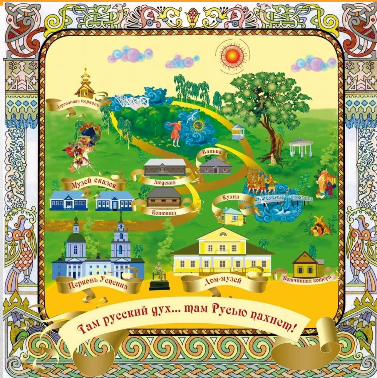
План Пушкинской усадьбы