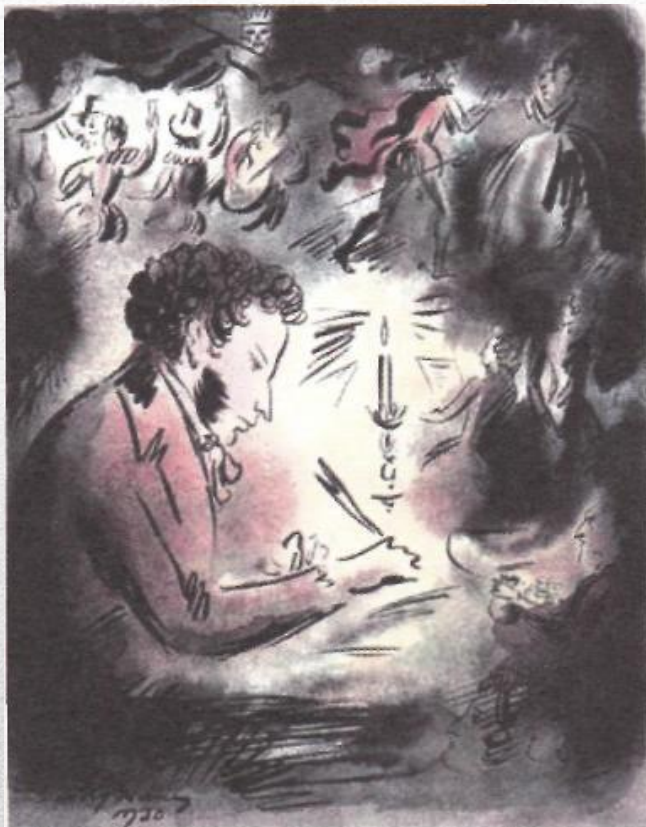
Пушкин в Болдине. Художник Н.В. Кузьмин. 1930 г.