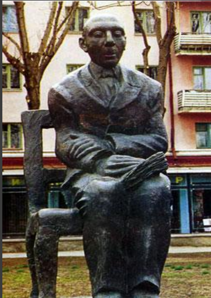
Памятник Т.Керашеву в Майкопе