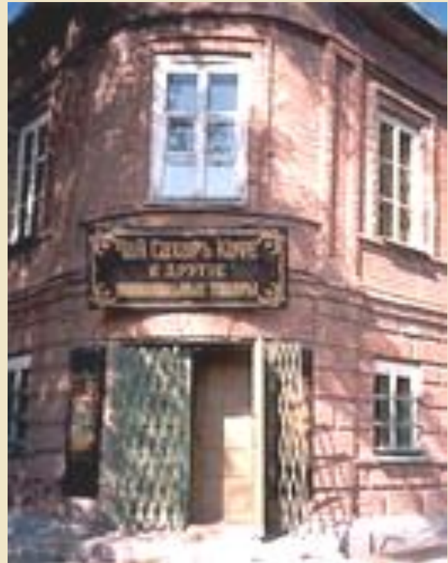
Лавка отца Чехова «Чай, сахар, кофе и другие колониальные товары»

В детстве Антон с раннего утра до позднего вечера работал в лавке.