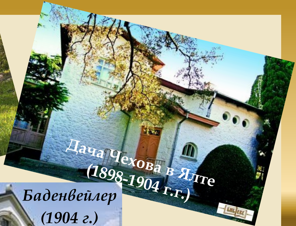
Дача Чехова в Ялте (1898-1904 г.г.)