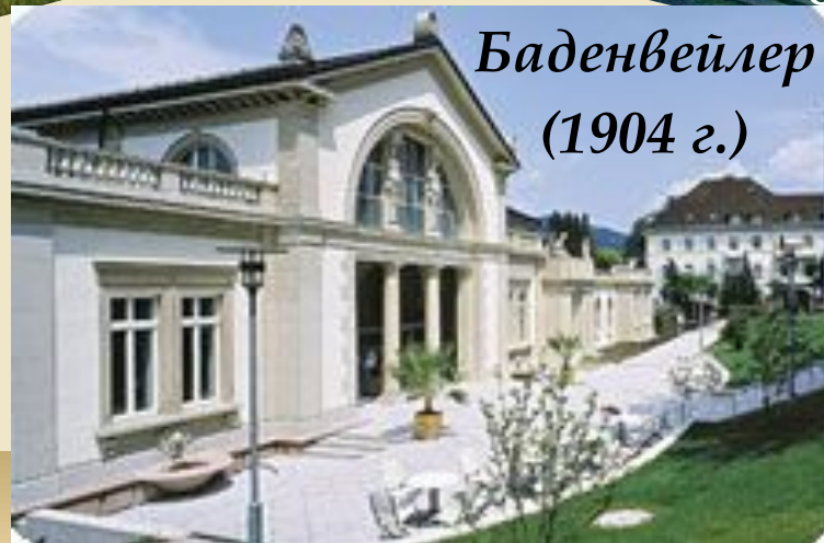
Баденвейлер (1904 г.)