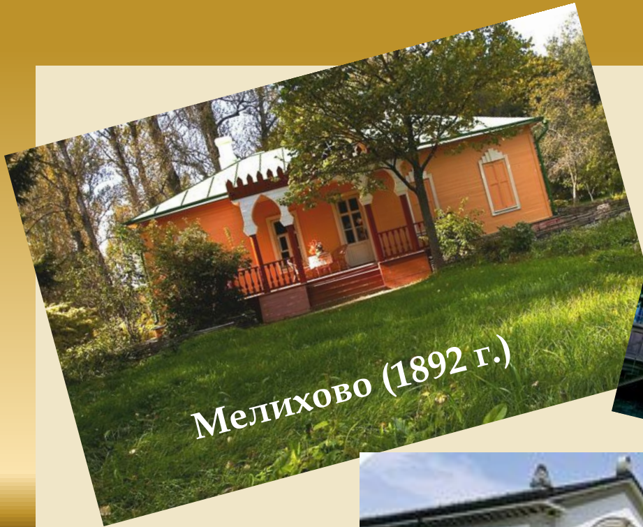
Мелихово (1892 г.)