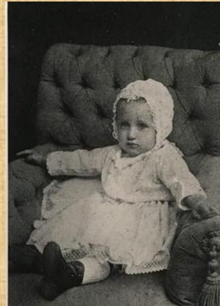
А. Ахматова в детстве