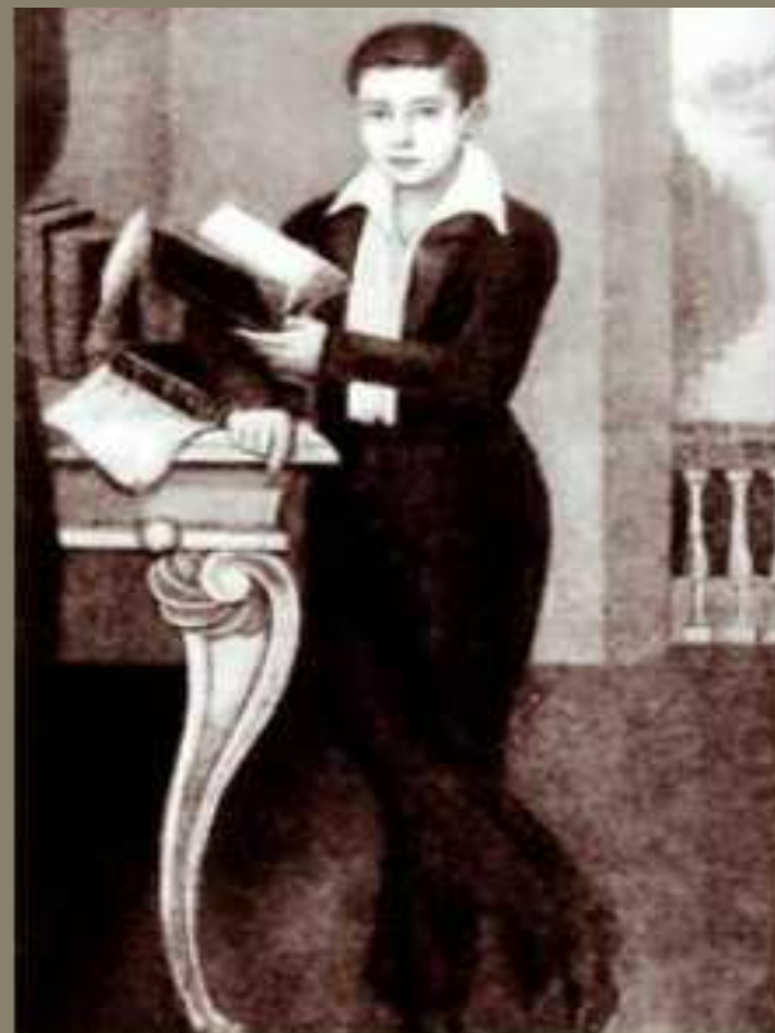
Юный А. С. Грибоедов в Хмелите