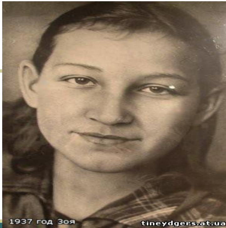
1937 год Зоя

его ударила своей палицей дружина сама земля русская выдает в него силы". И в те роковые минуты словно сама родная земля дала ей могучую, недевичью силу. Эту силу с изумлением вынужден был признать даже враг.