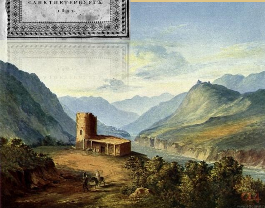
Военно-Грузинская дорога близ Мцхета. Картина М. Ю. Лермонтова.