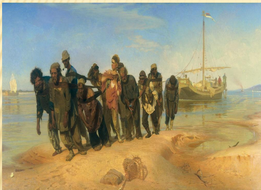
И.Репин «Бурлаки на Волге»

Бурла́к — наёмный рабочий в России XVI — начала XX веков , который, идя по берегу (по т. н. бечевнику ), тянул при помощи бечевы речное судно против течения. В XVIII—XIX веках основным типом судна, водимым бурлацким трудом, была расшива