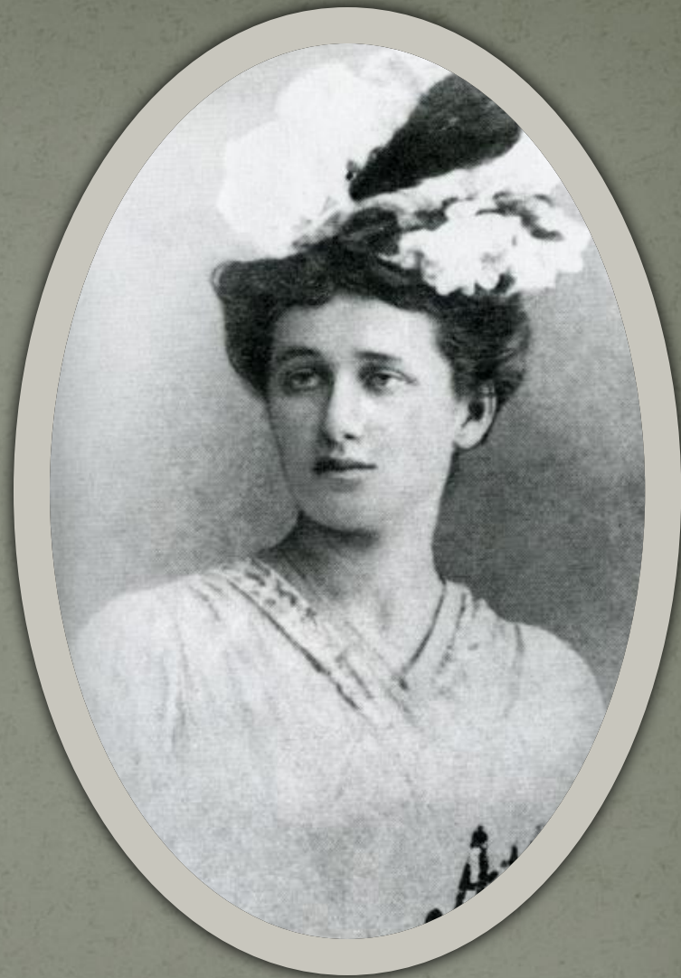
Фотографии Анны Ахматовой, сделанные в Севастополе.