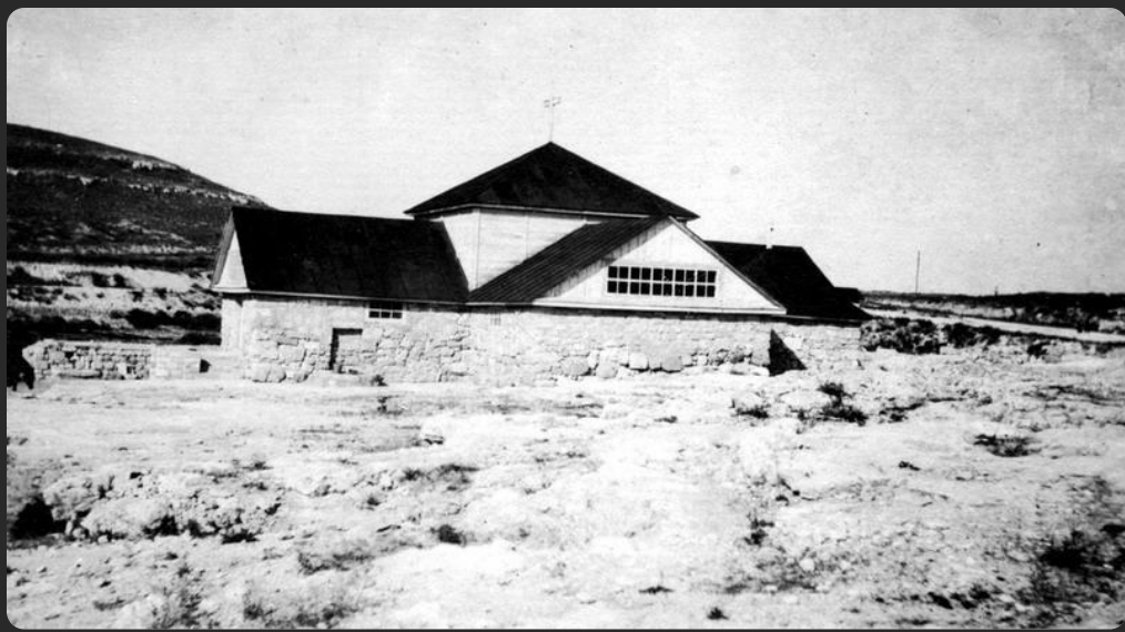
Дача Тура «Новый Херсонес»

На туrowsкой даче Анна Ахматова жила каждое лето с семи до тринадцати лет (с 1896 – 1902 гг.)