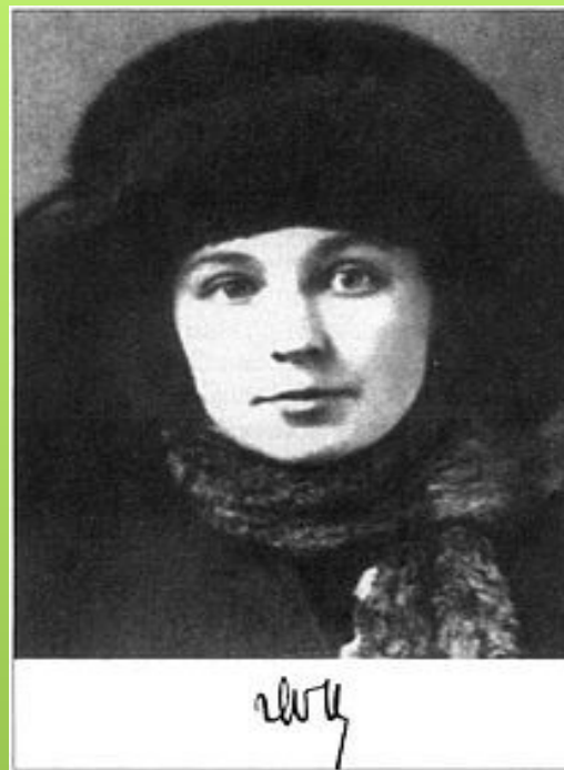
Марина Цветаева с автографом. Фото ок. 1917 года