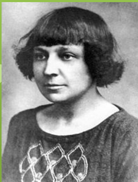
Марина Цветаева в 1924-м году