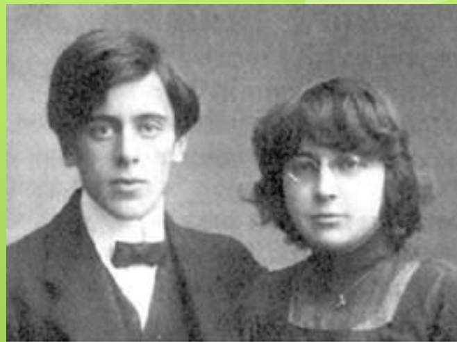
Сергей Яковлевич Эфрон и Марина Ивановна Цветаева