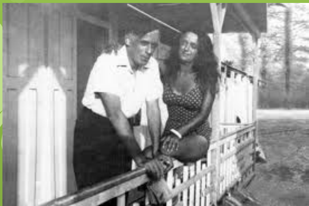
Сергей Эфрон с дочерью

Никто не может вообразить бедности, в которой мы живём. Мой единственный доход — от того, что я пишу. Мой муж болен и не может работать. Моя дочь зарабатывает гроши, вышивая шляпки. У меня есть сын, ему восемь лет. Мы вчетвером живём на эти деньги. Другими словами, мы медленно умираем от голода.