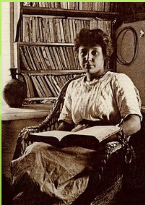
Марина Цветаева. 1911 год.