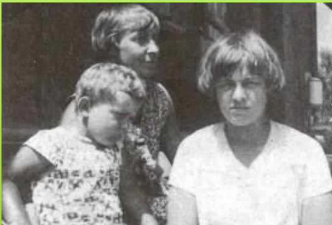
Мур (Георгий Эфрон), Марина Цветаева, Ариадна Эфрон