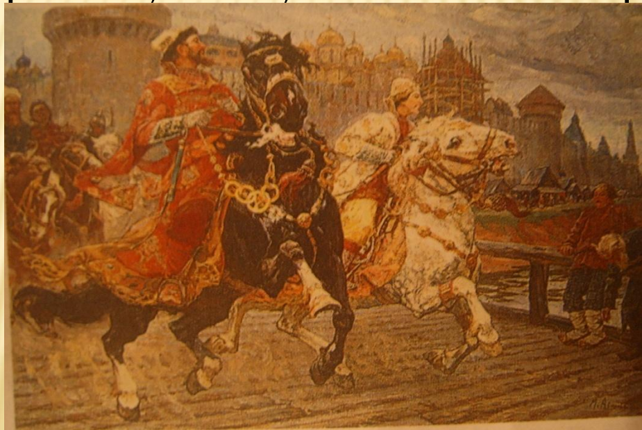
М.И. Авилов. «Царь Иван Грозный с опричником».

НА (опришнина, от древнерусского опричь — особо), наименование внутренней политики Ивана Грозного в 1565-1572 годах. Политика опричнины была направлена на искоренение предполагаемой измены в среде знати (массовые репрессии, казни, земельные конфискации).