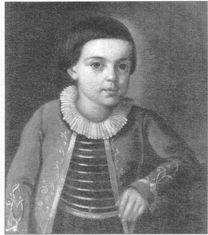
Лермонтов в детстве

Родился Лермонтов 3 октября в 1814г в Москве, свое детство провел в имении Тарханы Пензенской губернии, воспитывался бабушкой. Учился на дому, был прилежный ученик. Далее поступает в Московский Университет.