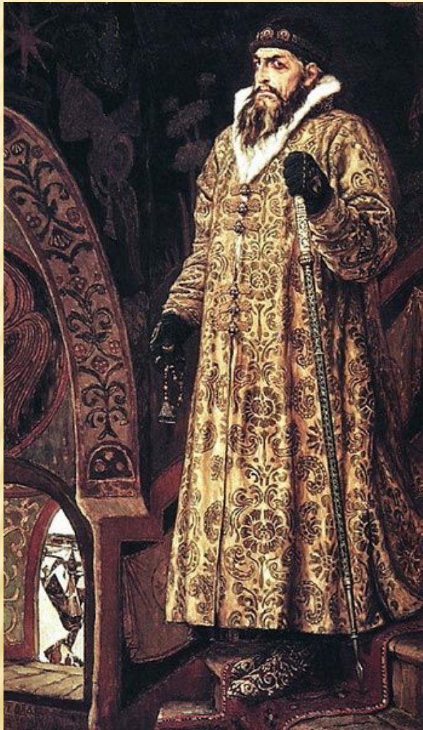
Иван IV Грозный

В 1837 году выходит «Песня про царя Ивана Васильевича молодого опричника и удалого купца Калашникова»