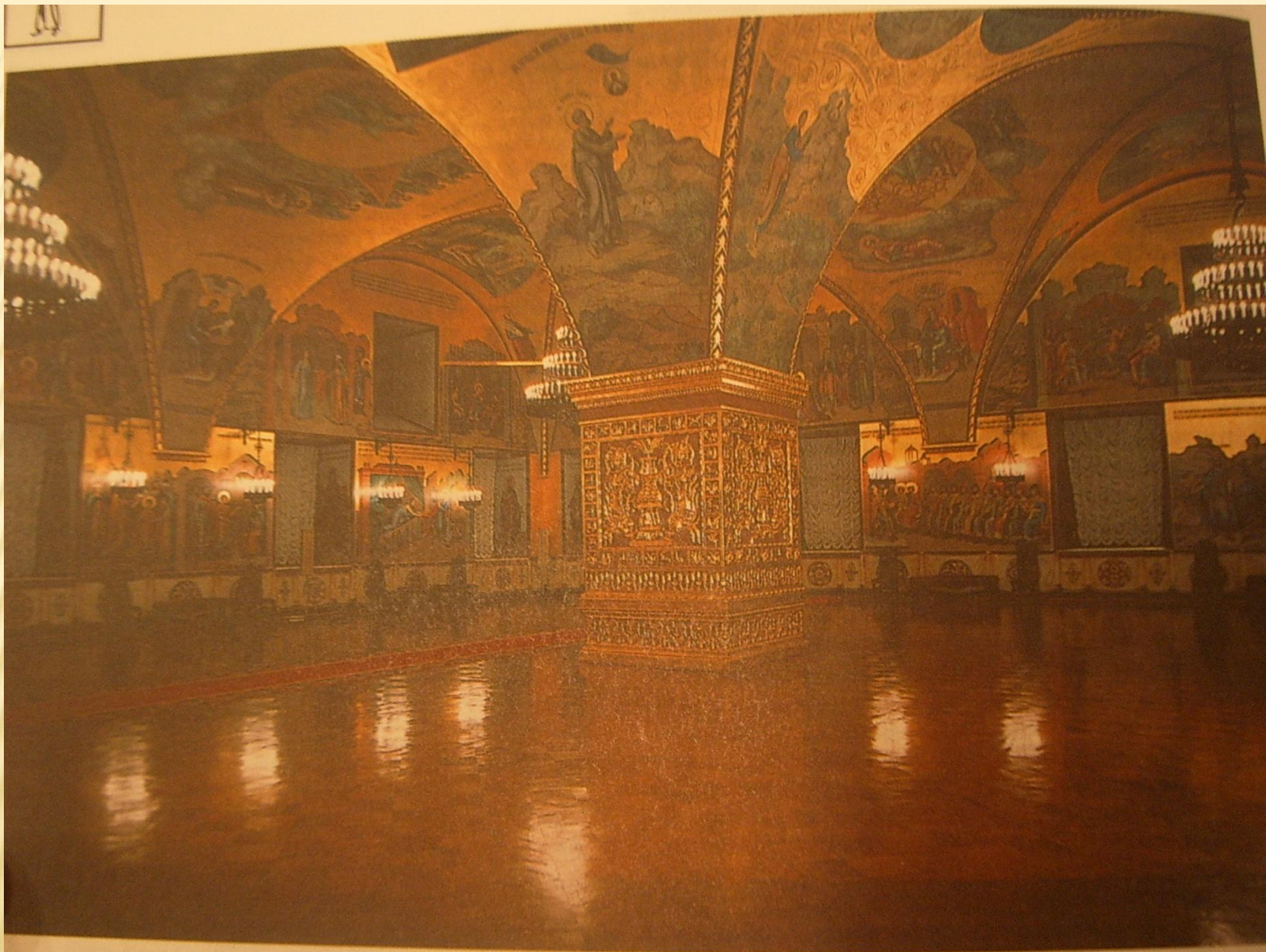
Грановитая палата Московского Кремля