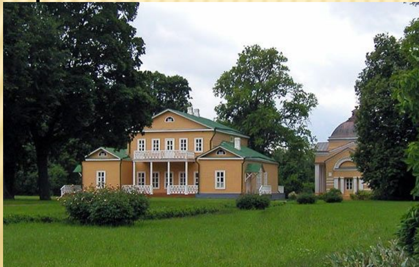
Тарханы. Усадебный дом Арсеньевых.