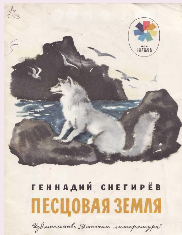
Снегирев Г. «Песцовая земля»