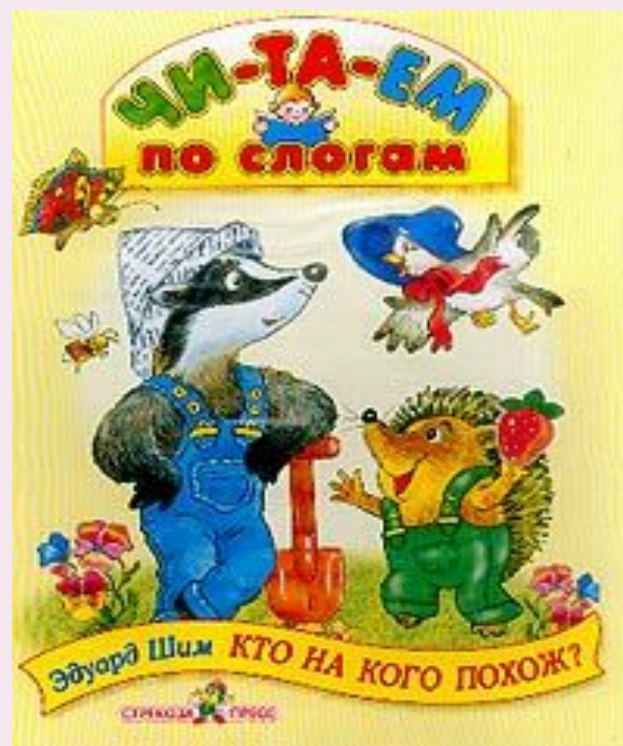
«К то на кого похож?»