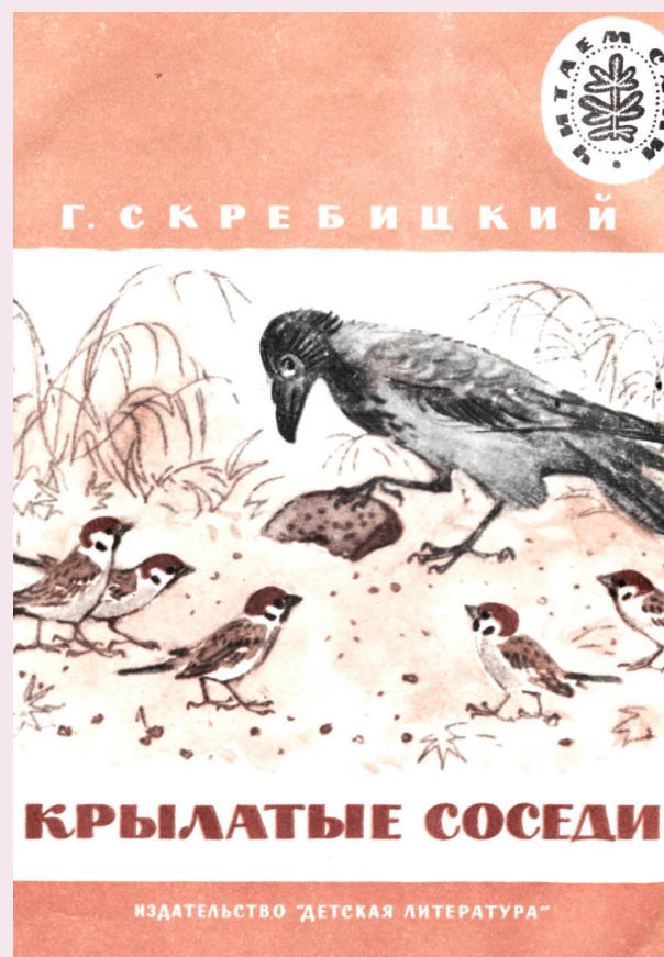
Скребицкий Г. «Крылатые соседи»