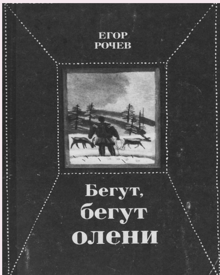
Рочев Е. «Бегут, бегут олени» М.: 1989г.