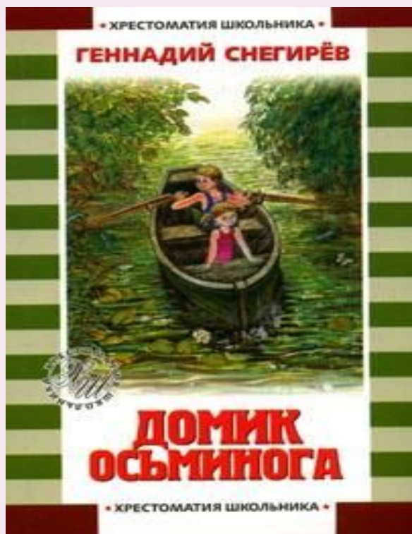
Снегирев Г. «Домик осьминога»