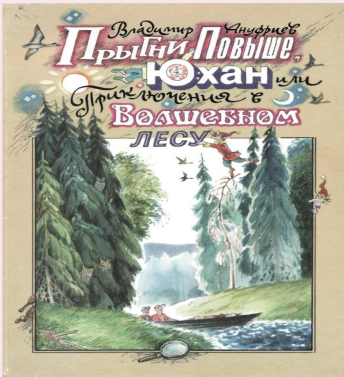
«Прыгни выше, Юхан»