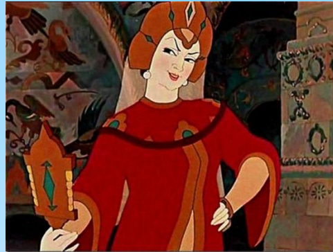
Сказка о мертвой царевне и семи богатырях