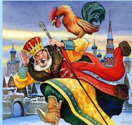
Сказка о золотом петушке