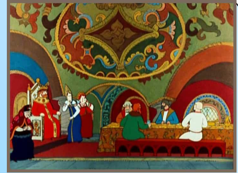
Сказка о царе Салтане