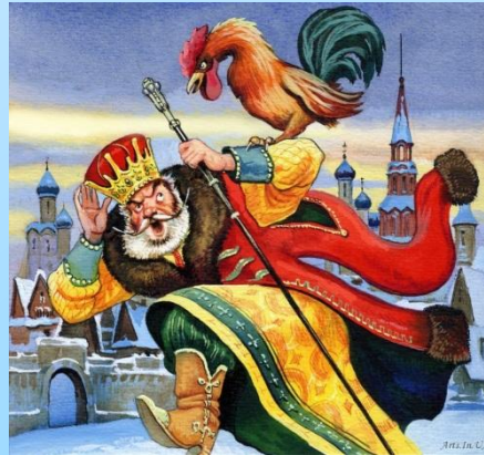
Сказка о золотом петушке