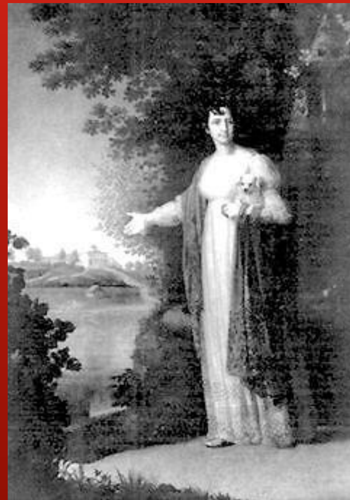
Дарья Алексеевна Дьякова (1767-1842), жена Г.Р.Державина

В 1794 году умерла жена Державина, Екатерина Яковлевна. В 1795 году Гаврила Романович женился второй раз, на Дарье Алексеевне Дьяковой (1767-1842). На сестрах Дьяковой - Александре и Марии - были женаты два других поэта того времени, Василий Васильевич Капнист и Николай Александрович Львов, с которыми Державина связывали не только родственные отношения, но и дружба