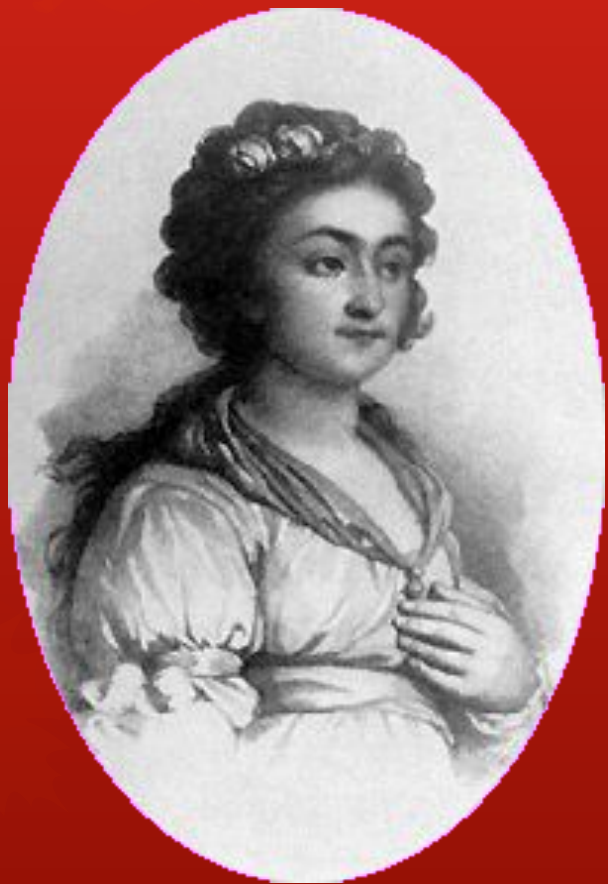
Первая жена Г.Р.Державина Екатерина Яковлевна Бастидон (1760-1794)

Найдя покровительство у князя Вяземского, Державин в 1777 году поступил на службу в Сенат. В следующем году он женился на Екатерине Яковлевне Бастидон. К этому времени денежные дела улучшились и помимо сенатского жалованья у Державина стало более тысячи душ крестьян. В 1780 году Гаврила Романович получил чин статского советника. Ода "Фелица", в которой восхвалялась Екатерина II, была напечатана в 1783 году. Стихотворение Державина растрогало императрицу до слез и в награду поэту была послана усыпанная бриллиантами золотая табакерка с пятьюстами червонцев