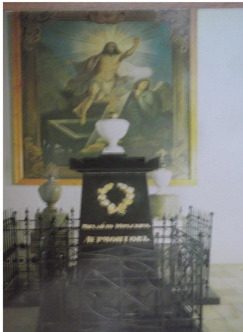
Памятник на могиле М. Ю. ЛЕРМОНТОВА.