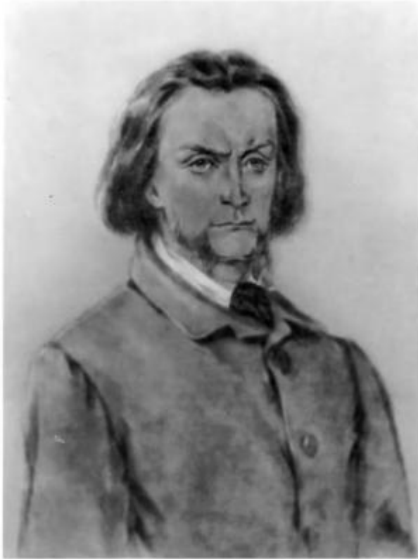
«Отцы и дети», Базаров. Иллюстрация П. М. Боклевского. 1870-е годы.