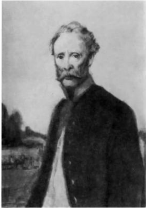
«Отцы и дети». Василий Иванович Базаров. Иллюстрация К. И. Рудакова, 1946—1947 гг.