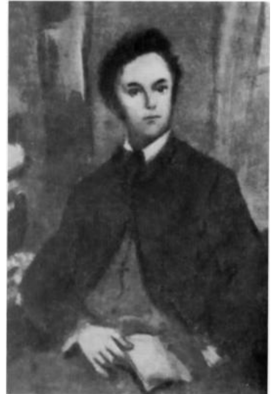
«Отцы и дети». Аркадий Кирсанов. Иллюстрация К. И. Рудакова. 1947 г.