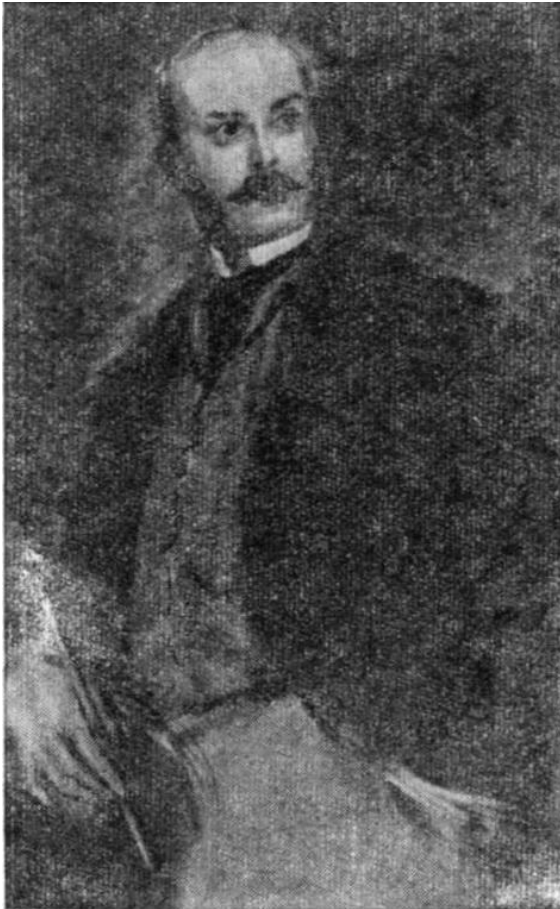
П. Кирсанов. Рисунок К. Рудакова