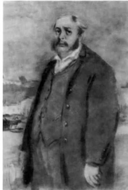
«Отцы и дети». Николай Петрович Кирсанов. Иллюстрация К. И. Рудакова. 1947 г.

Почему Николай Петрович не смог сделать военную карьеру как его брат Павел Петрович?