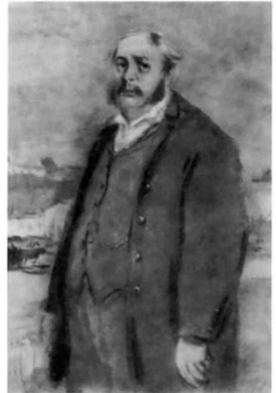
«Отцы и дети». Николай Петрович Кирсанов. Иллюстрация К. И. Рудакова. 1947 г.