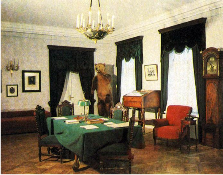
Приемная редакция журнала «Современник»

В начале 1860-х годов умер Добролюбов, были сосланы в Сибирь Чернышевский и Михайлов. Всё это стало ударом для Некрасова. Началась эпоха студенческих волнений, бунтов «освобождённых от земли» крестьян и польского восстания. В этот период журналу Некрасова было объявлено «первое предостережение». Выход в свет «Современника» приостанавливается, а в 1866 году, после выстрела Дмитрия Каракозова в российского императора Александра II, журнал закрылся навсегда. Некрасову, за годы своего руководства журналом, удалось преобразовать его в главный литературный журнал и прибыльное предприятие, несмотря на постоянное преследование цензорами. После закрытия журнала Некрасов сблизился с издателем Андреем Краевским и через два года после закрытия «Современника», в 1868 году, арендовал у Краевского «Отечественные записки», сделав их боевым органом революционного народничества и превратив их вместе с М. Е. Салтыковым-Щедриным в орган передовой демократической мысли.