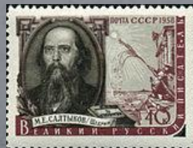
1976 г. Почтовая марка СССР