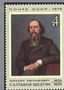
1958 г. Почтовая марка СССР