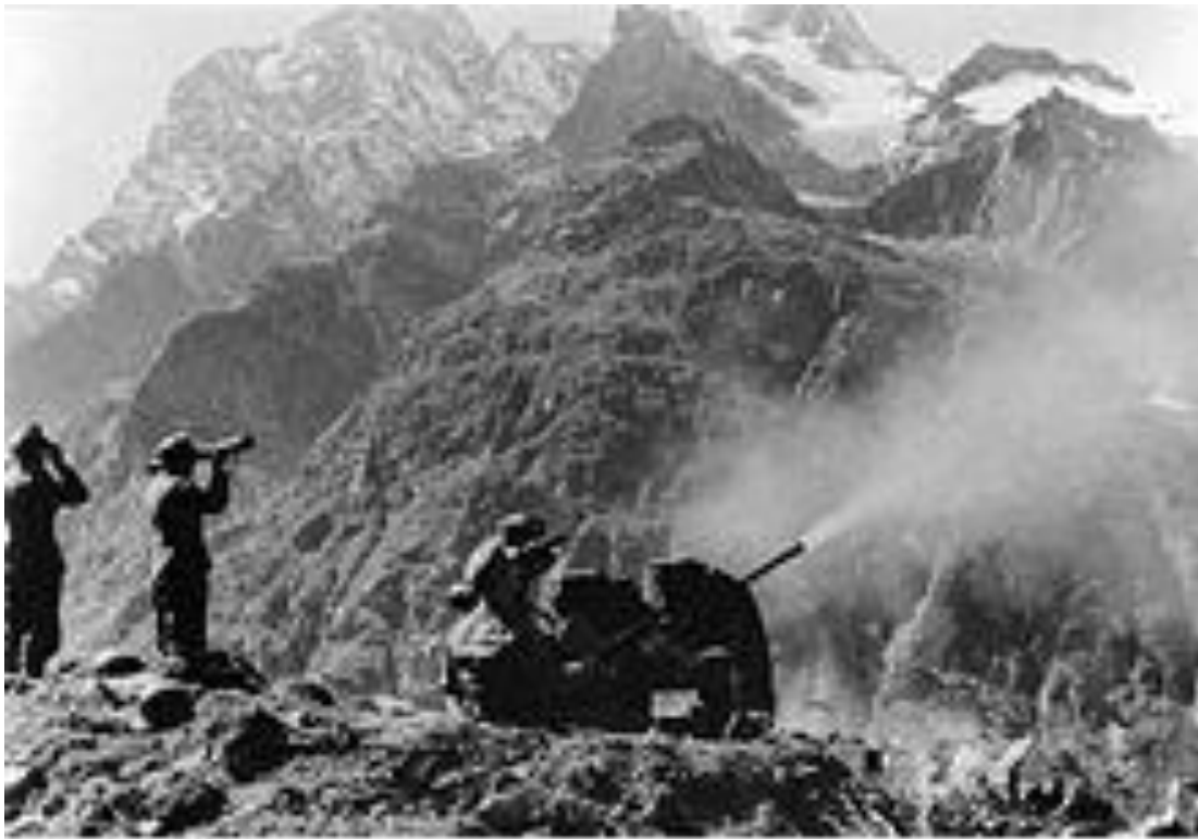
Битва за Сталинград Сентябрь 1942 г.