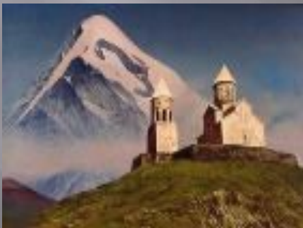
«Монастырь на Казбеке»