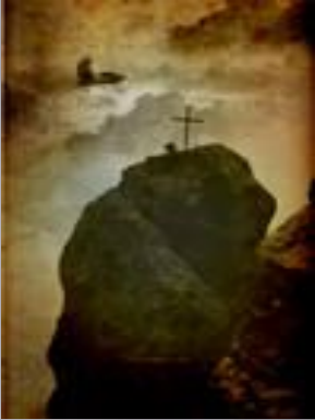
«Крест на скале»