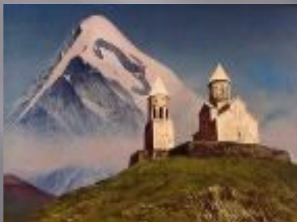
«Монастырь на Казбеке»