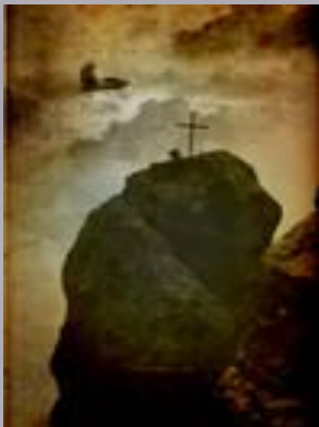
«Крест на скале»