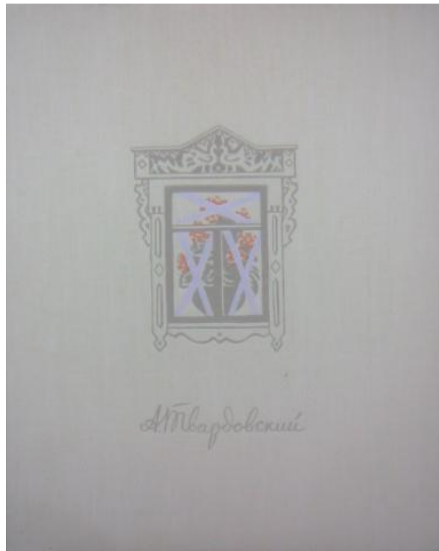
Дом у дороги. 1946 год.

В 1945 году была завершена работа над «Теркиным». Книга тут же издается и пользуется небывалой популярностью. В следующем году Александр Трифонович получил Государственную премию за «Василия Теркина». В этом же году написана поэма «Дом у дороги» – тоже о войне, но с трагической точки зрения. Как писал Самуил Маршак, «поэма могла родиться только в годы великого народного бедствия, обнажившего жизнь до самого основания». За эту поэму в 1947 году Твардовский так же получил Государственную премию