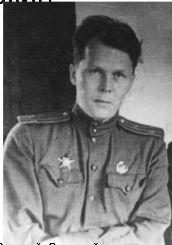
Твардовский- Военный корреспондент

После окончания в 1939г. Московского института философии, литературы и истории (ИФЛИ) Твардовский был призван в армию как военный корреспондент. Трудности, испытанные Красной Армией в зимнюю кампанию 1939/40гг. Подготовили поэта к трагедиям Великой Отечественной войны.