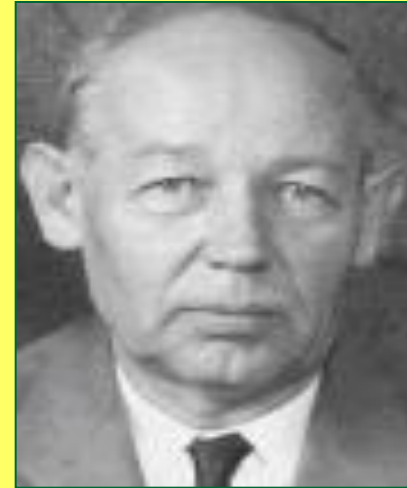
Русский геолог, исследователь Камчатки.