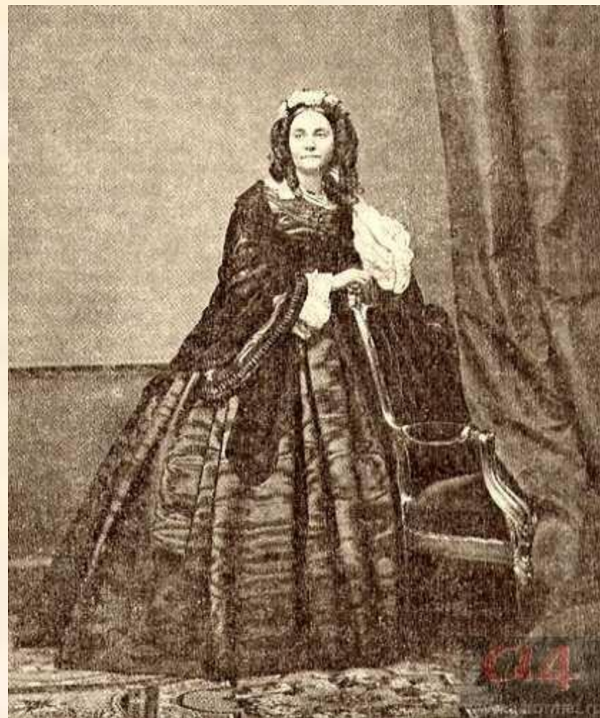
Эрнестина Федоровна Тютчева. Петербург. Фото 1862

Не знаю я, коснется ль благодать Моей души болезненно- греховной, Удастся ль ей воскреснуть и восстать, Пройдет ли обморок духовный? Но если бы душа могла Здесь, на земле, найти успокоенье, Мне благодатью ты б была — Ты, ты, мое земное провиденье.