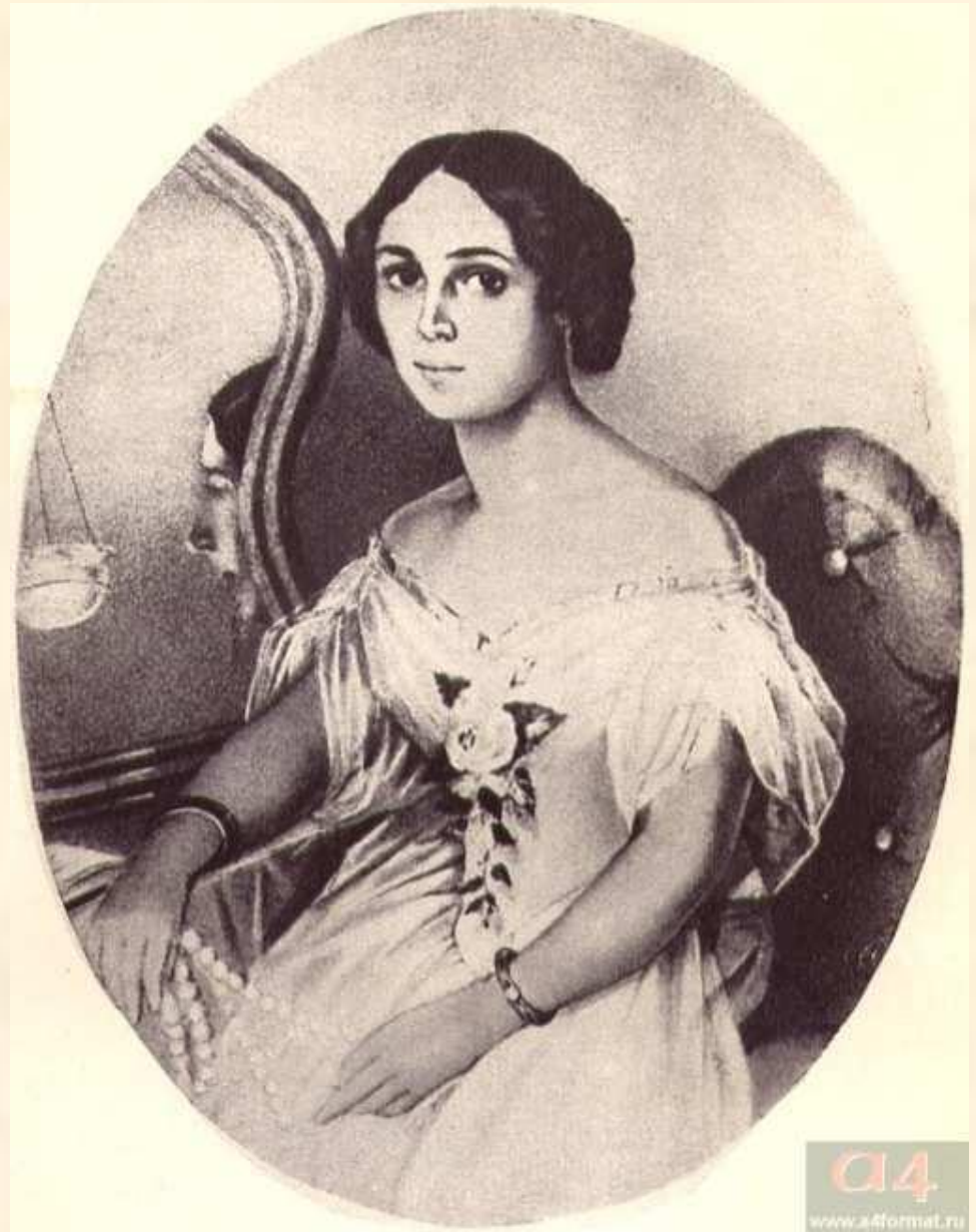
Е.И. Денисьева. Художник Иванов. 1850-е