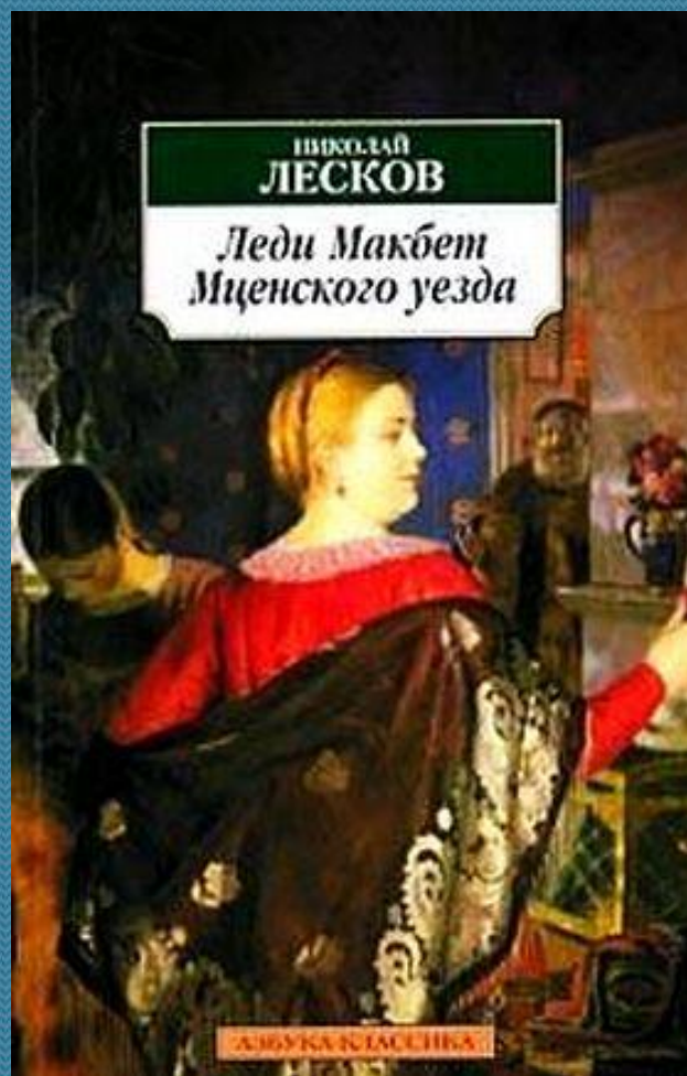
повесть Лескова «Леди Макбет Мценского уезда»