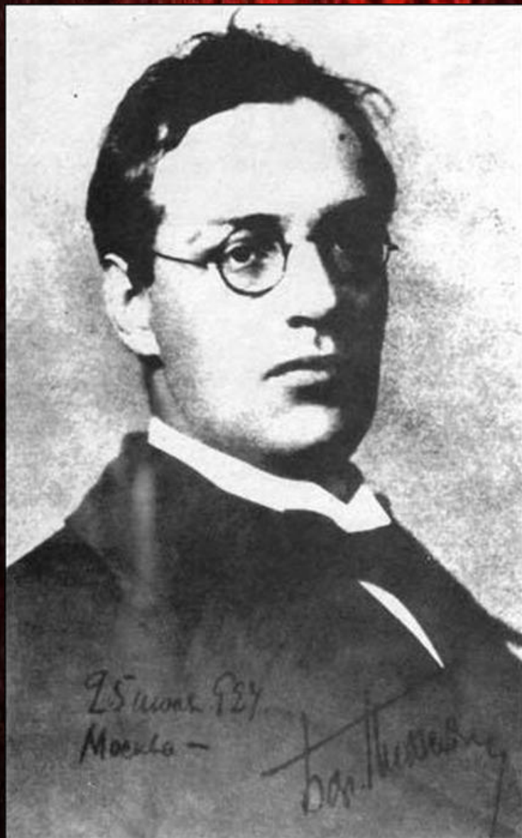
Борис Андреевич Пильняк (Вогау) 1894-1938