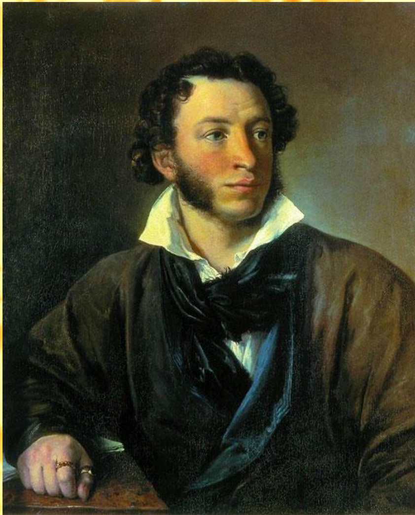
В.А. Тропинин. "Портрет Пушкина". 1827 г. Холст, масло. Портрет Тропинину заказал сам Пушкин и подарил его своему другу С.А. Соболевскому.