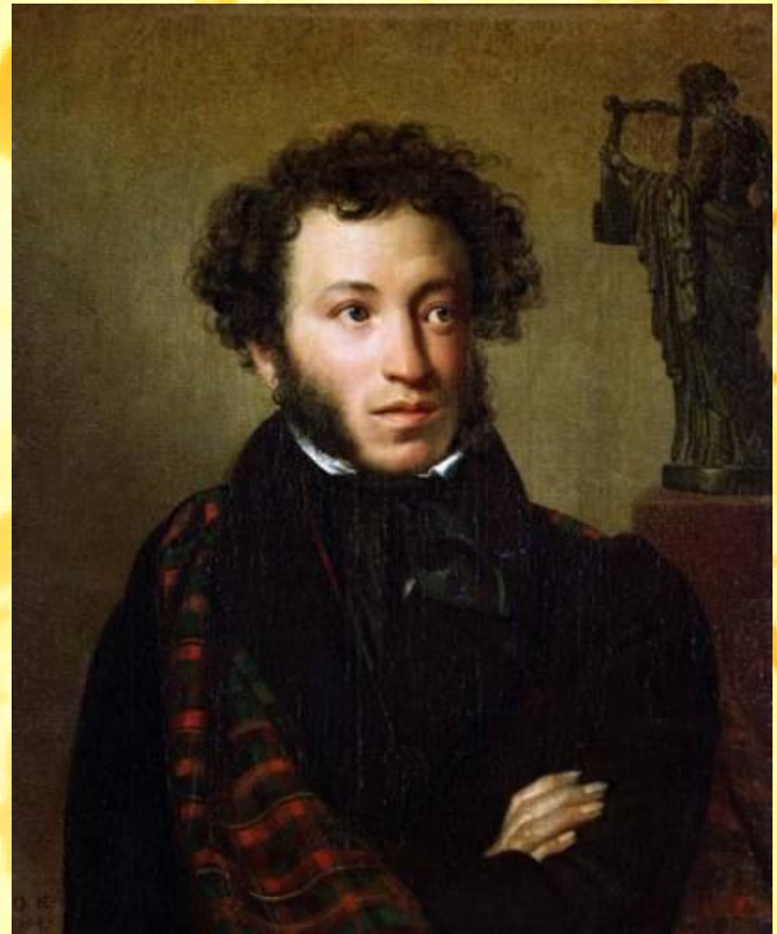
О.А. Кипренский. "Портрет Пушкина". 1827 г. Холст, масло. О поразительном сходстве портрета с Пушкиным говорили его современники. Так, например, Н.А. Муханов сказал: "С Пушкина списал Кипренский портрет необычайно похожий."