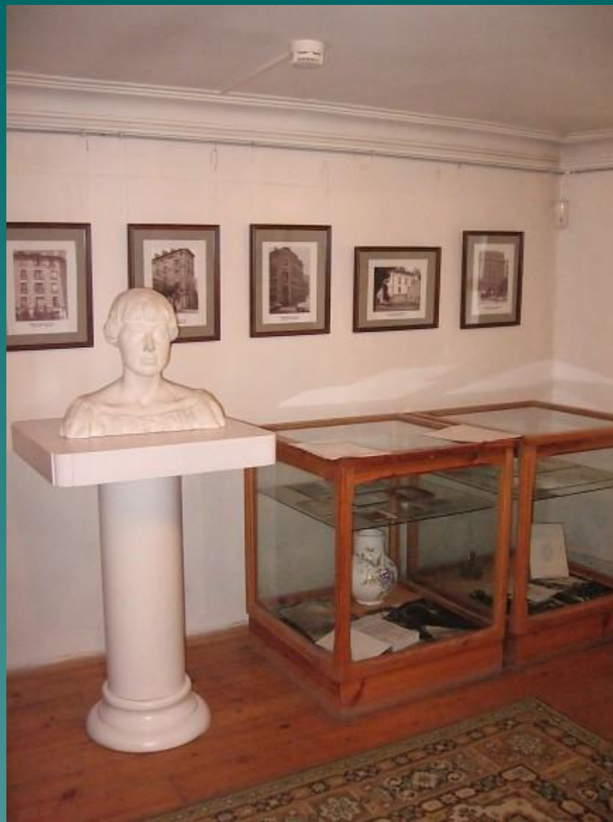
Кухня, превращенная в выставочный зал