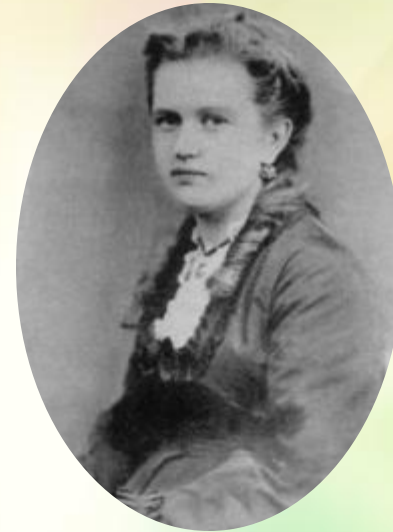
А. Л. (Львова) Толстая. Мать А.Н.Толстого