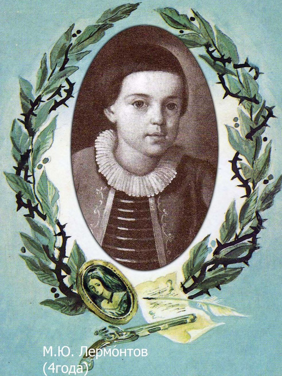
М.Ю. Лермонтов (4года)