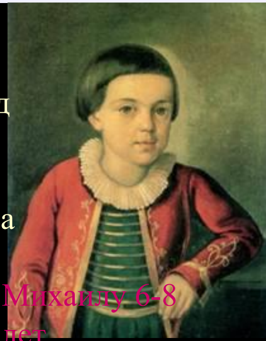
Михаилу 6-8 лет

И вижу я себя ребёнком, и кругом Родные все места: высокий барский дом И сад с разрушенной теплицей; Зелёной сетью трав подёрнут спящий пруд, А за прудом село дымится — и встают Вдали туманы над полями.